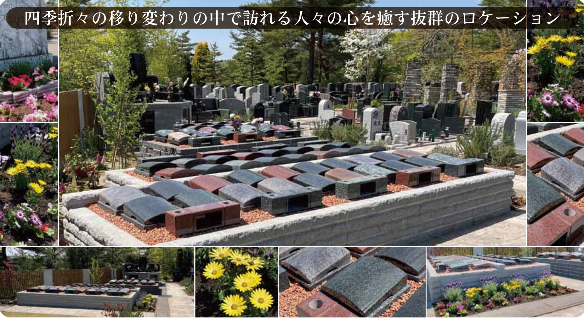
四季折々の移り変わりの中で訪れる人々の心を癒す抜群のロケーション